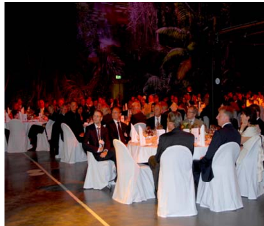
Festlicher Rahmen im Panometer Leipzig