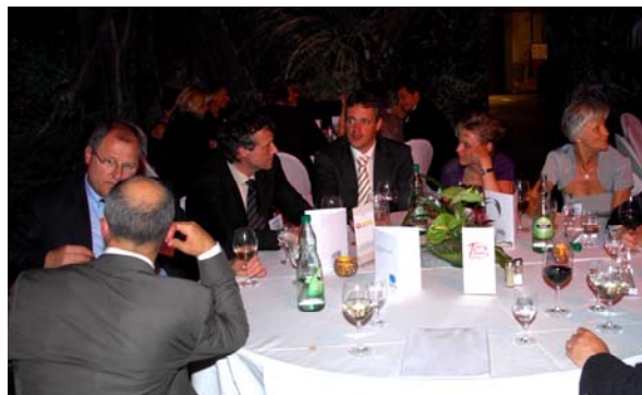
Laden Sie Ihre Franchise-Nehmer zur Gala ein und buchen Sie einen Tisch für Ihr System