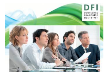
CHANCEN UND HERAUSFORDERUNGEN FÜR KÜNFTIGE UND JUNGE FRANCHISEGEBER