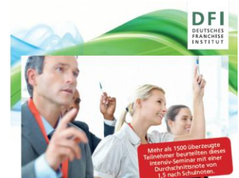
DIE 51. SCHULE DES FRANCHISING

Für alle Seminare des Deutschen Franchise-Instituts (DFI) kann seit 2013 eine Bildungsprämie beantragt werden. Als Bildungswerkstatt und Weiterbildungseinrichtung erfüllt das DFI die Qualitätskriterien des Bundesministeriums für Bildung und Forschung, so dass Seminar-Teilnehmer künftig bis zu einem Betrag von maximal 500 Euro förderungsberechtigt sind. Weitere Informationen unter www.franchise-institut.de/bildungspraemie.html